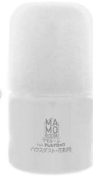
マモルーム 取替えボトル